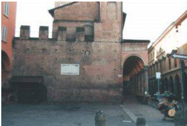
fig. 4: un tratto della cerchia dei Torresotti presso Piazza Verdi