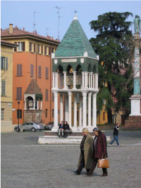
fig. 1: Arca di Rolandino de Passeggeri (piazza San Domenico)